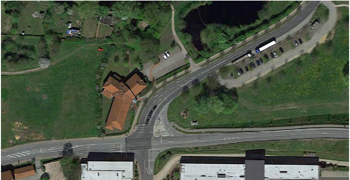
Abbildung 1 Ausschnitt aus dem Luftbild